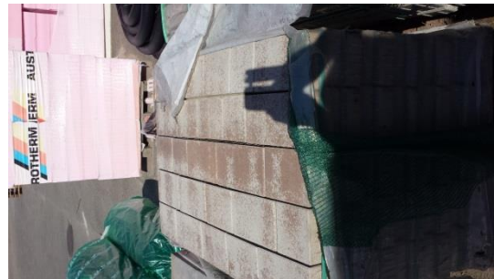
ca 10 m2 Betonstein Rettango cappuccino € 70,-