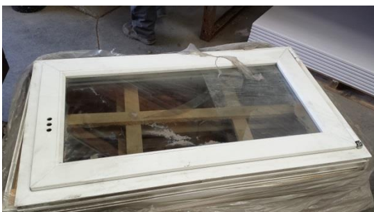
Kellerfenster m. Zarge 100x60 cm € 75,-