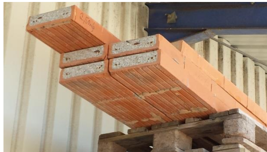
28 m 1 Überlagen Höhe 6,5x24 cm € 100,-