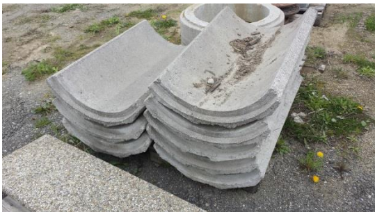
Betondrittelschale Gesamtpreis € 35,-