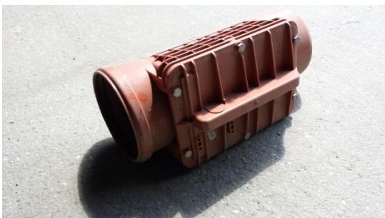
9 St. Putzstück DN 200 per St. € 30,-