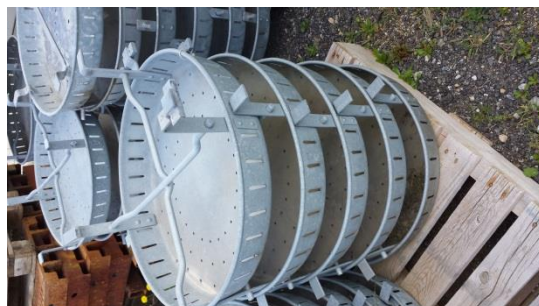
Schmutzfänger f. Strasseneinlauf € 10,-