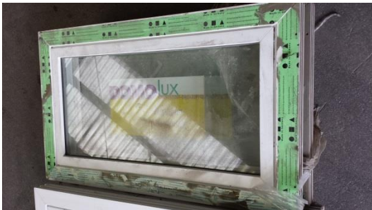
5 St. Domo Kellerfenster per St. € 50,-