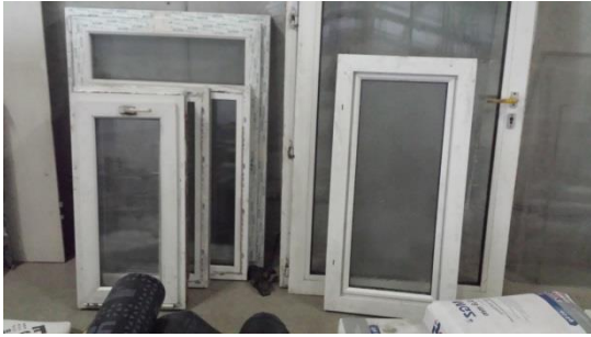
Div. Fenster ab € 20,-