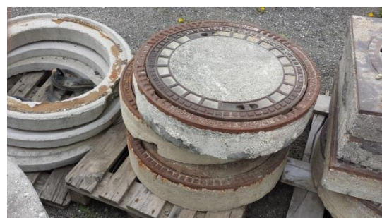
Schachtdeckel € 20,-