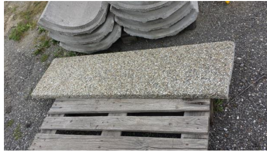
Waschbetonstufenplatte € 10,-