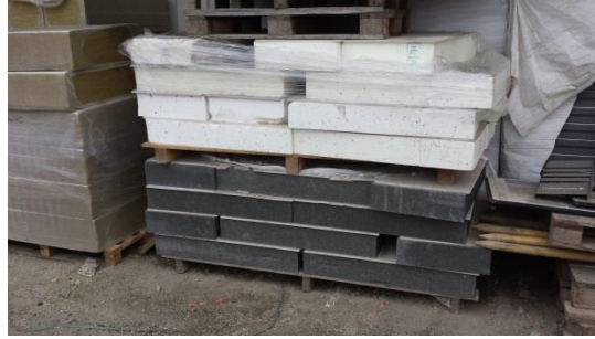
ca. 20 m2 Dachbodendämmelemente € 100,-