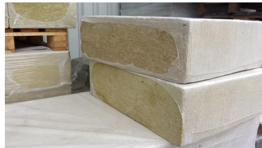
10 m2 Steinwolle Fassadendämmplatte 2 cm € 150,-