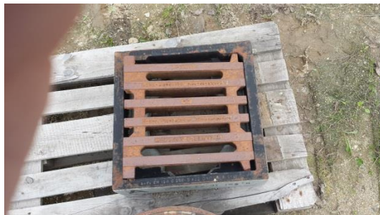
Schachtgitter € 30,-