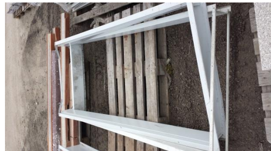
7 St. Zarge a € 10,-