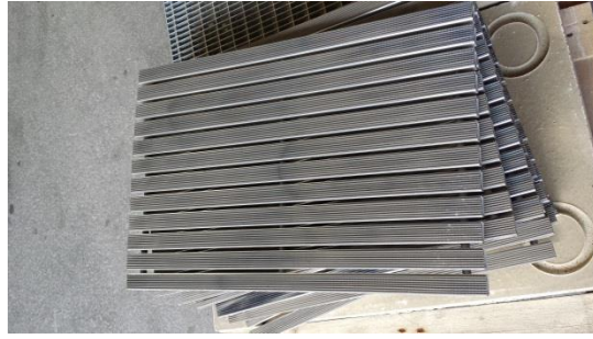
Fussabstreifmatte € 10,-