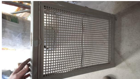
Stahlkellerfenster 80x50 cm € 25,-