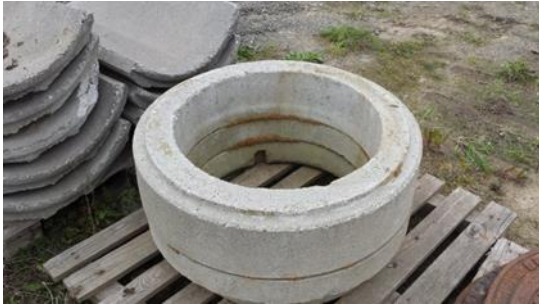
Betoning € 10,-