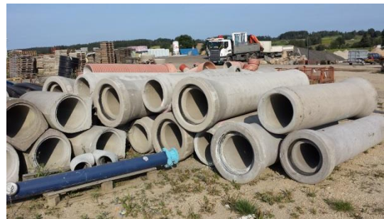
Betonglockenmuffenrohre DN 300 1 m € 15,- DN 300 3 m € 30,-