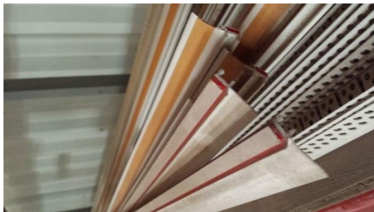
13 St. Apu-Leiste gesamt € 10,-