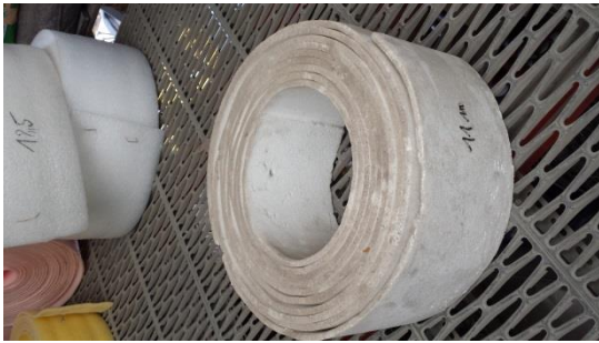
179 m1 Randstreifen 50x10 mm € 10,-