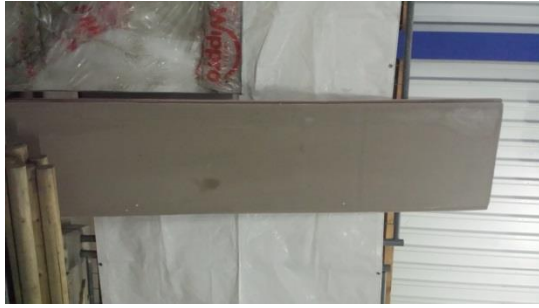
Uni-Platte per St. € 10,-