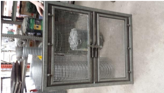
Stahlkellerfenster 100x80 cm € 50,-