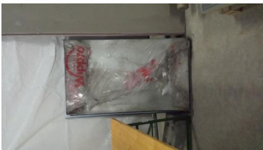
Oberdeckel f. Dachbodentreppe 30,-