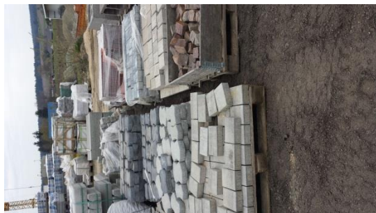
Div. Betonsteine per m2 € 5,-