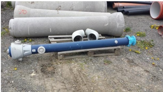
Hydrant € 300,-