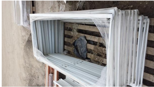
Stahlzargen per Stk. € 5,-