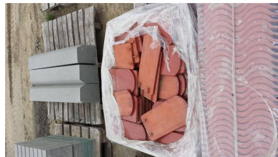
1 Pal.Tondachziegel € 30,-