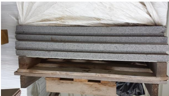
65 m2 Deckendämmelement € 300,-