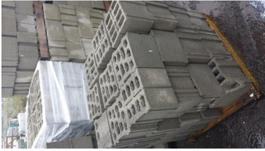
Kiesblöcke per Palette € 50,-