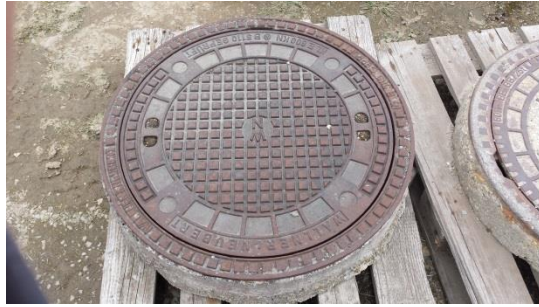
Schachtdeckel € 30,-