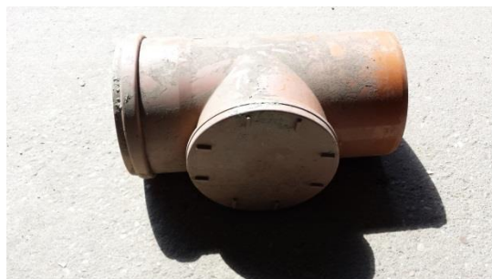
Putzstück DN 200 € 20,-