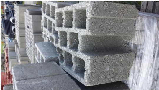
120 St. Kies Mauerstein 38/30/22 cm € 100,-