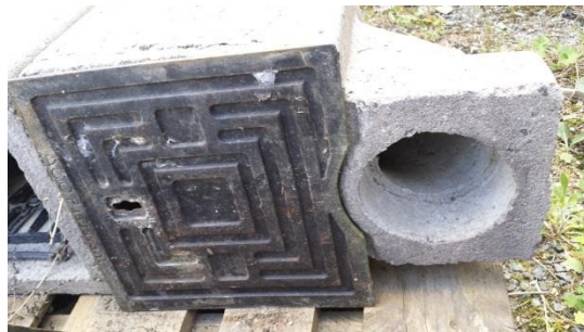
4 St. Betonregensinkkasten per St. € 30,-