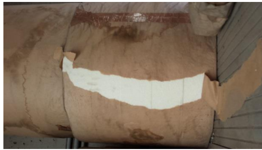
500 m1 Randstreifen 100x10 mm € 50,-