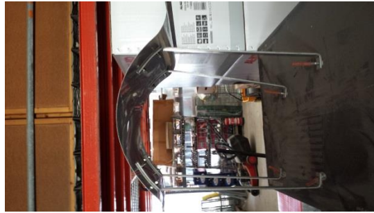
3 St. Niro Kamindach 57x57 cm € 75,-