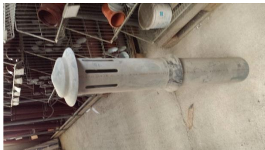
Dunsthut DN 150 mm € 10,-