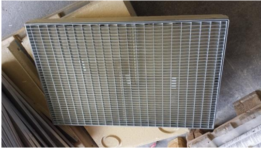
Fussabstreiferwanne ohne Gitter € 20,-